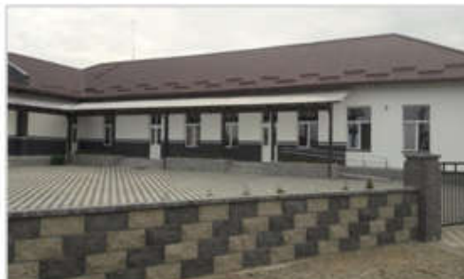
Școala Gimnazială Nr. 2 Horodnic de Sus (unitate arondată)