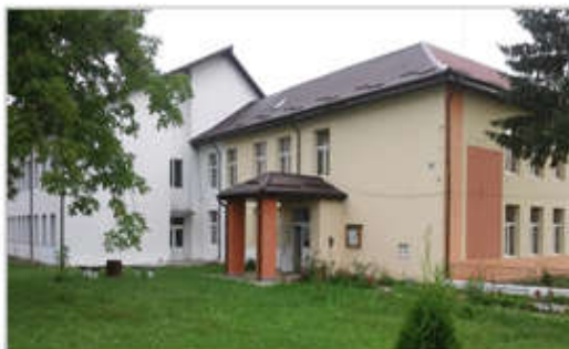
Școala Gimnazială "Tulian Vesper" Horodnic de Sus (unitate cu personalitate juridică) și Grădinița cu program normal Nr.1 Horodnic de Sus (unitate arondată)