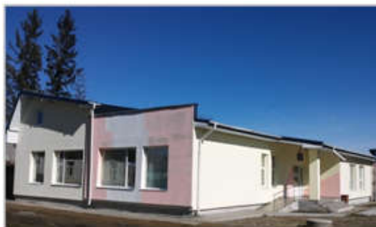
Grădinița cu program normal Nr.2 Horodnic de Sus (unitate arondată)