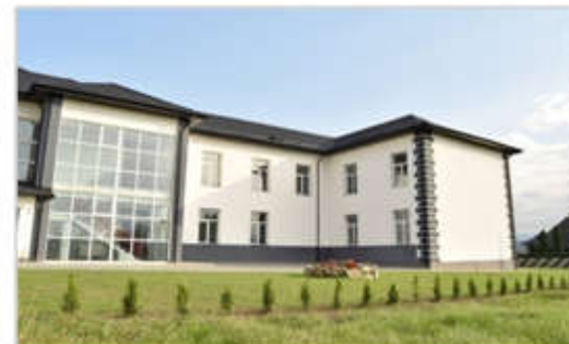
Școala Gimnazială Nr.3 Horodnic de Sus (unitate arondată) și Grădinița cu program normal Nr.3 Horodnic de Sus (unitate arondată)