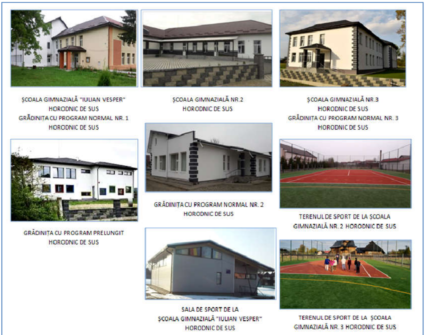
FIG. 1. Spațiile unităților de învățământ din comuna Horodnic de Sus.