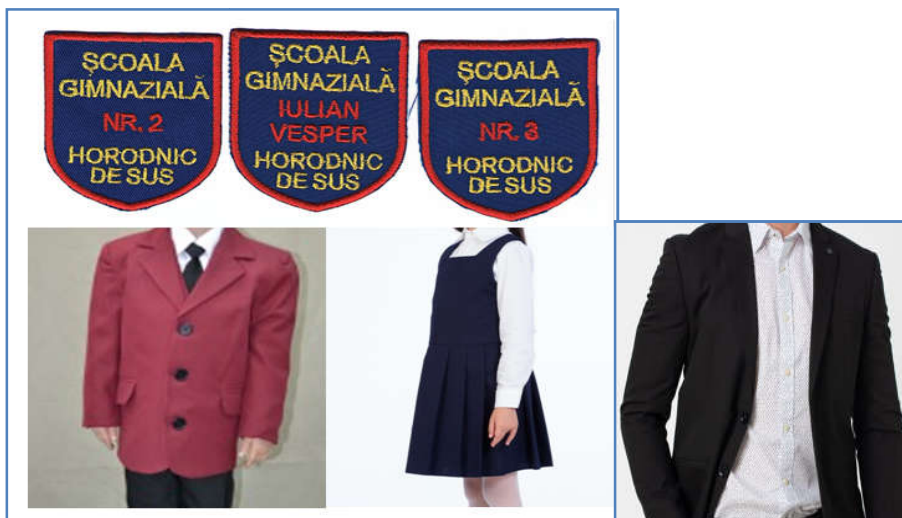
FIG.2. Elemente de identificare. Ecusoanele și uniforma elevilor școlilor din Horodnic de Sus.